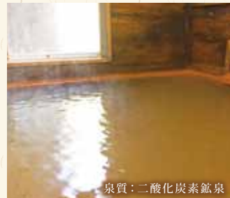
泉質：二酸化炭素鉱泉