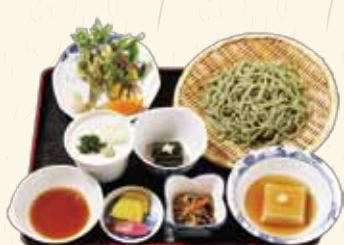
よもぎ麦きり膳 1,500円(税別)

季節の山菜やきのこなどを旬の食材を使用し、自然の恵を味わっていただける精進料理です。 ※旬の食材を使うので時期によっては若干内容が異なります。