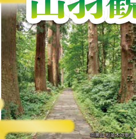
羽黒山 杉並木の参道