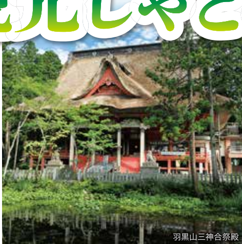
羽黒山三神合祭殿